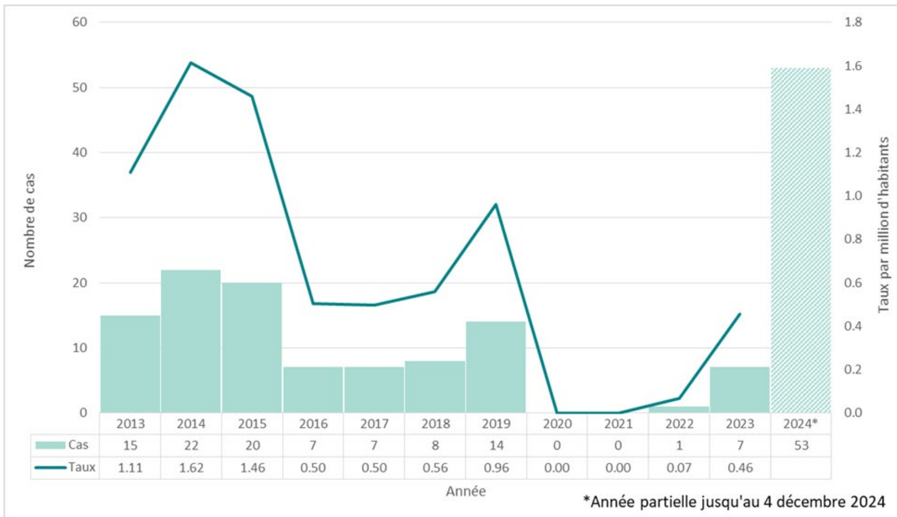
Figure 2 : Nombre de cas de rougeole et taux d'incidence par million d'habitants, Ontario, du 1 er janvier 2013 au 4 décembre 2024