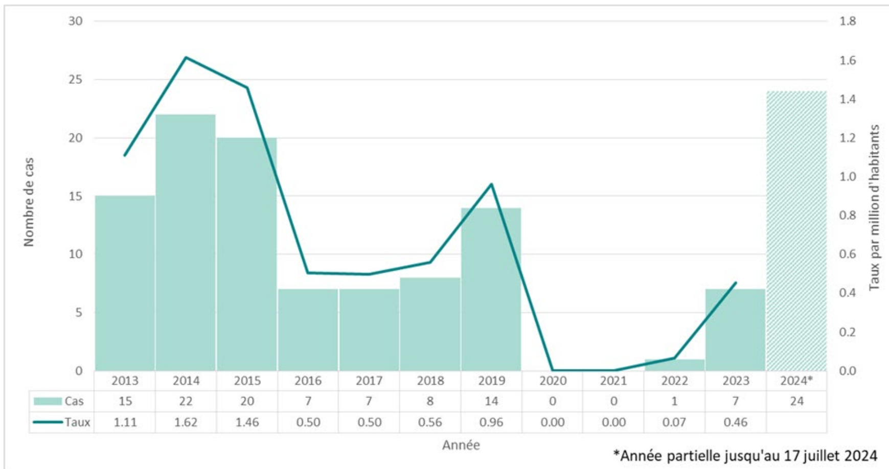
Figure 2 : Nombre de cas de rougeole et taux d'incidence par million d'habitants, Ontario, du 1 er janvier 2013 au 17 juillet 2024