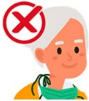
autour du cou