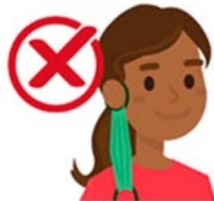
Pendu à une oreille