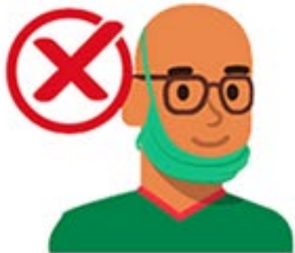
Sur le menton