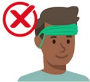
sur le front