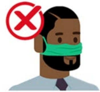
Sur le nez seulement