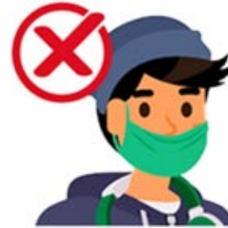
Sous le nez